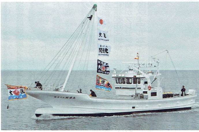
無事竣工した第五十八開運丸

期待される。北海道支店(根室市)が建造した。中央ブリッジで全長23.5m、全幅4.7m。主機はヤンマー6A