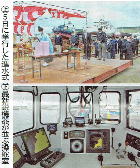
北海工機機製 ウィンチ

YB-WGT(最大出力594キロワット)の808馬力。国の漁船リース事業を活用した。バルバス・パウ構造で安定感が増した。ベックアラダーも搭載され小回りが利く。作業効率は間違いなくアップした。何より安心感が持てる」と笑