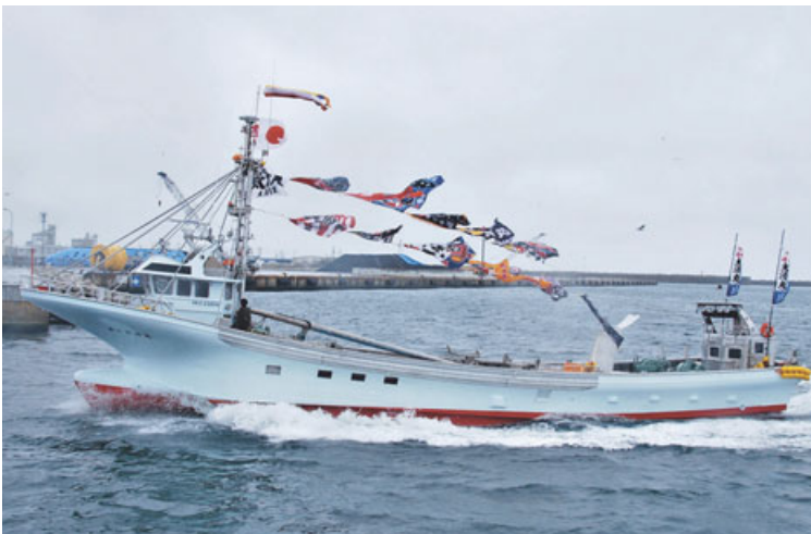
網走初の船首ブリッジアルミ船の勇壮な姿を披露、波を切り快走する第三太清丸