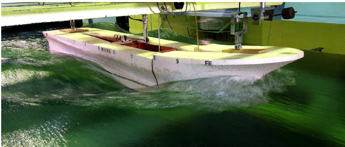
— 第18初丸 ( F_n = 0.384 ) —