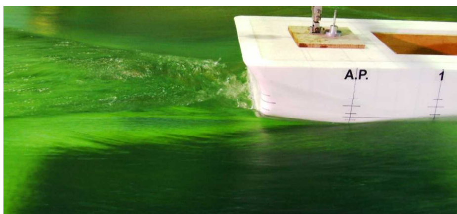
— M改I船型 ( F_n = 0.371 ) —