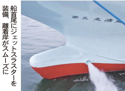
船尾にジェットスラスタを装備。離着岸がスムーズに