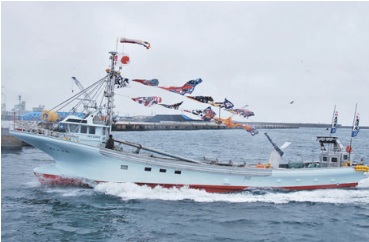
網走初の船首ブリッジアルミ船の勇壮な姿を披露。波を切り快走する第三太清丸